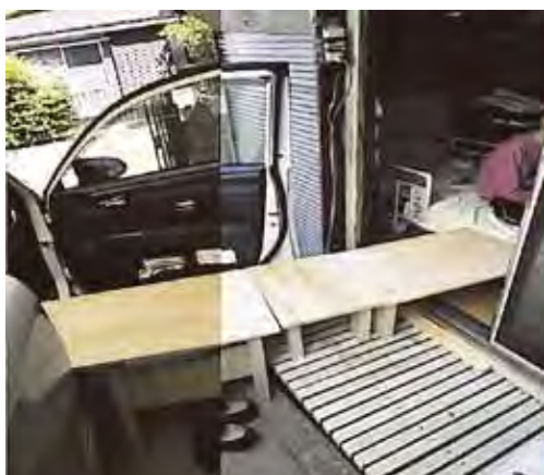
ベッドから運転席までのスロープの設置

主人公は、住み慣れた家や地域で生活されているご利用者です。訪問看護ステーションにおける連携とは、ご利用者の「こうしたい！」に対して主治医やケアマネジャー、福祉用具業者、訪問介護事業所、市町村の障害福祉課の担当者などの多職種とそれぞれの専門的意見を交えることでご利用者が希望される生活の実現を目指すことだと思います。