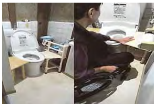
トイレへの移乗用台の設置